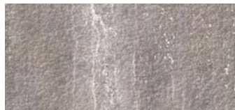
GR09 Gris Geo

GRESS sind dünne, großflächige Porzellanplatten mit hohen Leistungsmerkmalen, die zu 100% aus Mineralstoffen bestehen. Ein Produkt mit besonderen physischen und mechanischen Eigenschaften, die weit über industrielle und standardmäßige Anforderungen hinausreichen. Die Aufnahme von Wasser und chemischen Produkten bei Gress beträgt 0%, die Reinigung ist einfach.