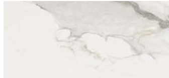
GR05 Calacatta Matt