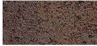
GR03 Iron corten