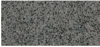
GR01 Basalt grey