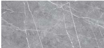
GR04 Zaha Stone