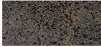
GR02 Iron moss