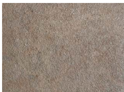
HD14 Esterel Wraky