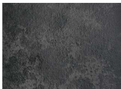
HD13 Oxide Grigio 545