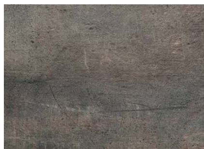
HD10 Rocks Climb 596