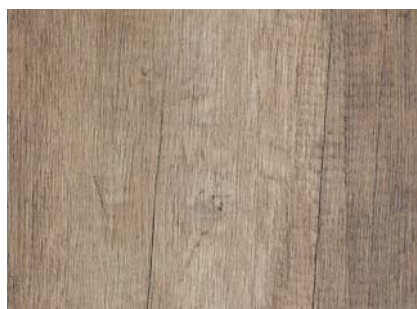
HD11 Legni Root 669