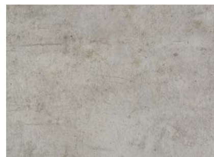
HD12 Rocks Climb 559