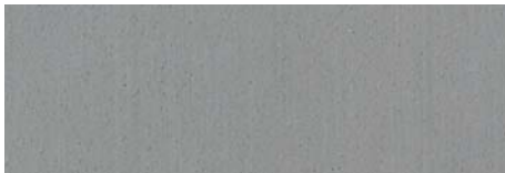
DE05 Cement grey (ähnlich RAL 7037)

TECNORIL® ist ein vielseitiger acryl-gebundener Mineral-Werkstoff, der seit vielen Jahren erfolgreich im Badezimmer im Einsatz ist. Dieser hochwertige Werkstoff wird nicht nur im Bad eingesetzt, sondern auch im Wohnbereich, in Küchen und im Objektbereich wie z. B. in Büros, Hotels, in der Gastronomie, im Gesundheitswesen, im Ladenbau und im Schiffsbau. Tecnoril® hat eine perfekt gleichmäßige und widerstandsfähige Oberfläche wie aus einem Guss. Tecnoril® lässt nahezu unendliche Formen, Gestaltungs- und Bearbeitungs-Möglichkeiten zu. – Der Werkstoff ist eine kostengünstige Alternative zu Corian®.