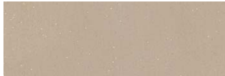
DE03 Cappuccino (ähnlich RAL 1019)